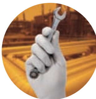
Osetlivosť dodira za komplikovane poslove